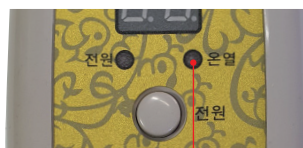
온열동작 표시 (온열동작시 표시)