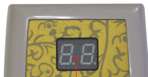
현재온도 표시 (온도설정시 설정온도 표시)